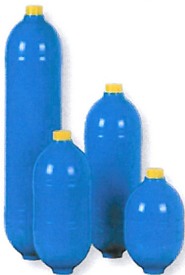
(1) wersja US. (2) na zamówienie; zawór P1620.

Prosimy o kontakt w przypadku zapotrzebowania na inne gwinty po stronie olejowej..